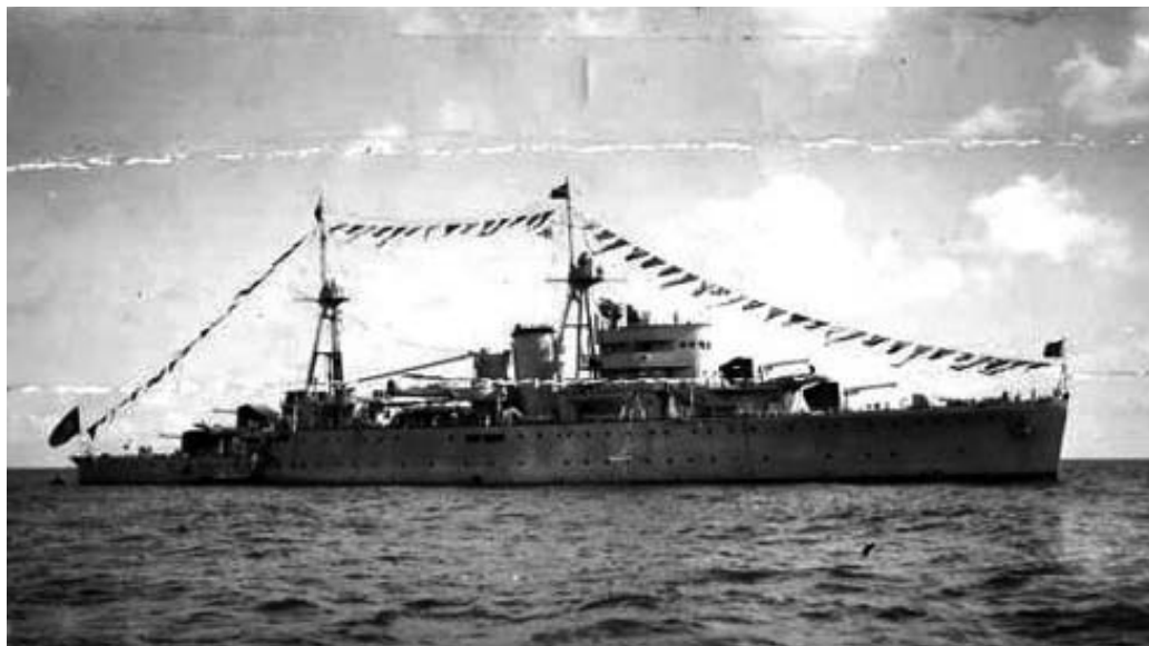
L'Avviso portoghese ALFONSO DE ALBUQUERQUE intervenuto per salvare i naufraghi del Nova Scotia.

i suoi uffici si mettessero in contatto con Lisbona e aveva fatto chiedere a quel governo, neutrale, di inviare soccorsi sul luogo dell'affondamento, molto vicino al Mozambico, allora colonia portoghese.