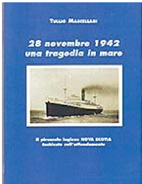
La copertina del libro di Tullio Mascellari.

I rapporti tra i prigionieri di guerra e gli internati civili italiani, da una parte, e i loro sorveglianti, dall'altra, erano buoni e non dettero luogo alle atrocità riscontrate nell'episodio del Laconia . Nonostante questo, le perdite degli italiani sul loro totale furono di 651 su 769 (85%), mentre nel caso del Laconia erano state di 1.300 su 1.800 (72%). L'affondamento del Nova Scotia , perciò, fu una vera tragedia, come indicato nel titolo di questo articolo. ■